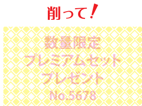
※100円玉でスクラッチを削ってください。

月刊MARUSHO 1月号で掲載した「運試しスクラッチ」配布後、お客様から「具体的にどうやって活用すれば良いの?」というご質問を多く頂きました。今回は急速スマートスクラッチの活用事例をご紹介します!