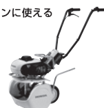
耕うん機 ピアンタ